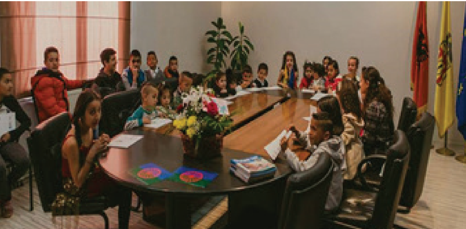
Aktivite festive për 8 Prillin, Vitin e Ri dhe shpërndarje dhuratash për fëmijët.