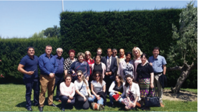
35 lider komuniteti të trajnuar mbi shërbimet për zhvillimin e fëmijërisë së hershme, menaxhimi I marrëdhënieve në komunitet dhe fuqizimi i bashkëpunimit me Pushtetin lokal;