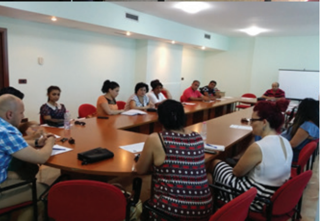
Tryeza të rrumbullakta me pjesëmarrjen e ofruesve të shërbimeve në nivel lokal.